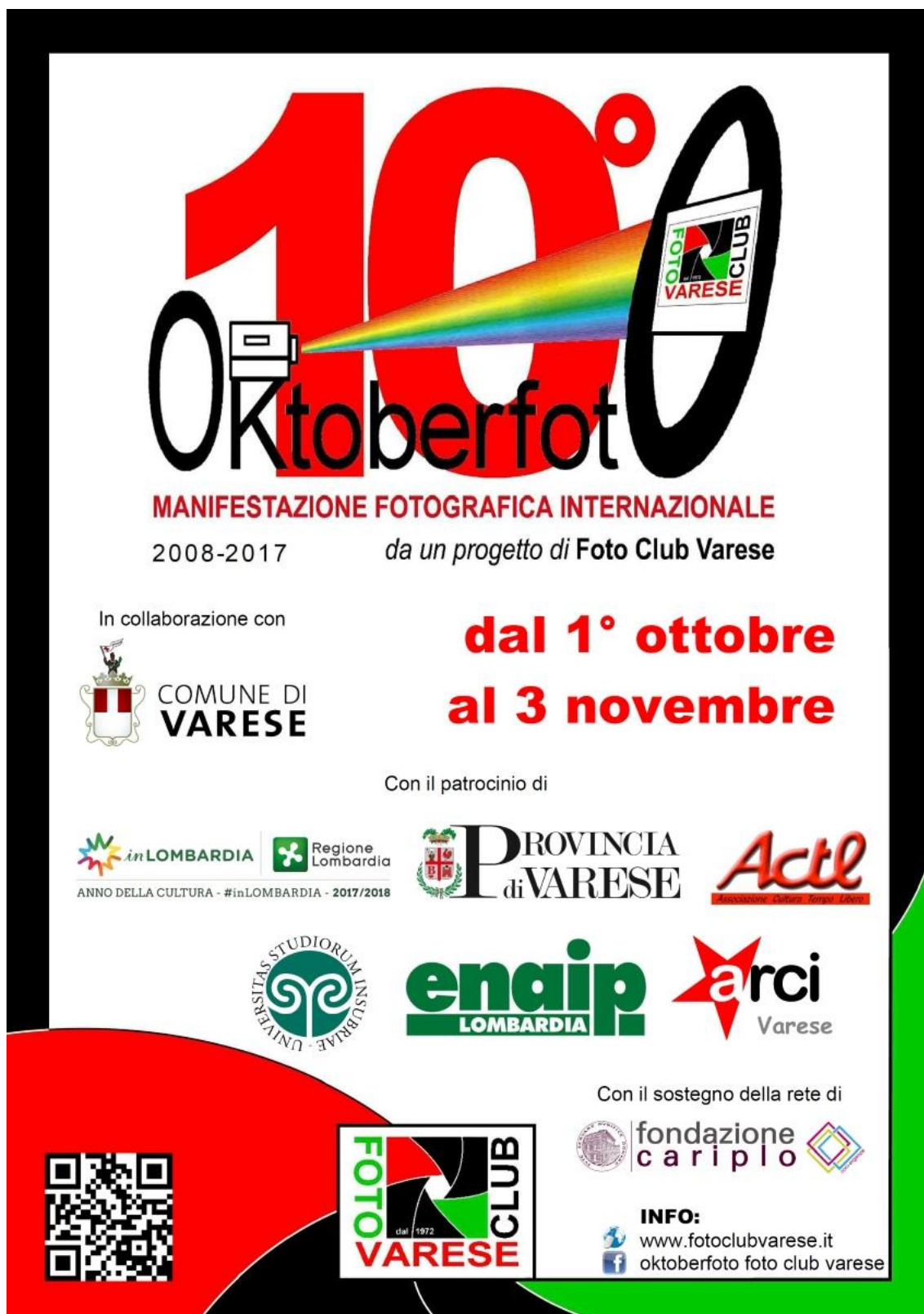
Foto Club Varese, in collaborazione con il Comune di Varese, il Patrocinio della Regione Lombardia, della Provincia di Varese, dell'Università dell'Insubria, di ACTL Varese, ARCI Varese, Enaip Varese e il Sostegno della Rete Convergenze, presenta la decima edizione di Oktoberfoto. Un evento fotografico internazionale che porta Varese al centro della fotografia con la partecipazione di Associazioni Fotografiche, Autori stranieri